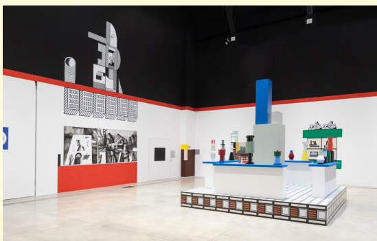
Nathalie Du Pasquier, vue de l'exposition Campo di Marte, SOLO/ MULTI , Musée de l'imagination préventive, MACRO 2021.

Exposition réalisée en partenariat avec le MACRO de Rome