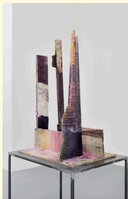
Antoine Renard, Olla-chitecture study 02 , 2020.