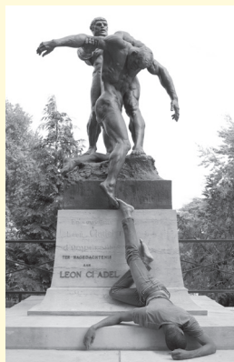
Jimmy Robert, Sans titre (Ompdrailles) , 2013.

Commissariat : Laure Martin-Poulet & Clément Nouet