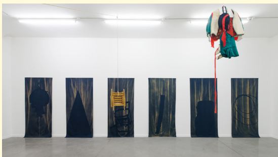
Ulla von Brandenburg, vue de l'exposition L'hier de demain , au Mrac, Sérignan, 2019.