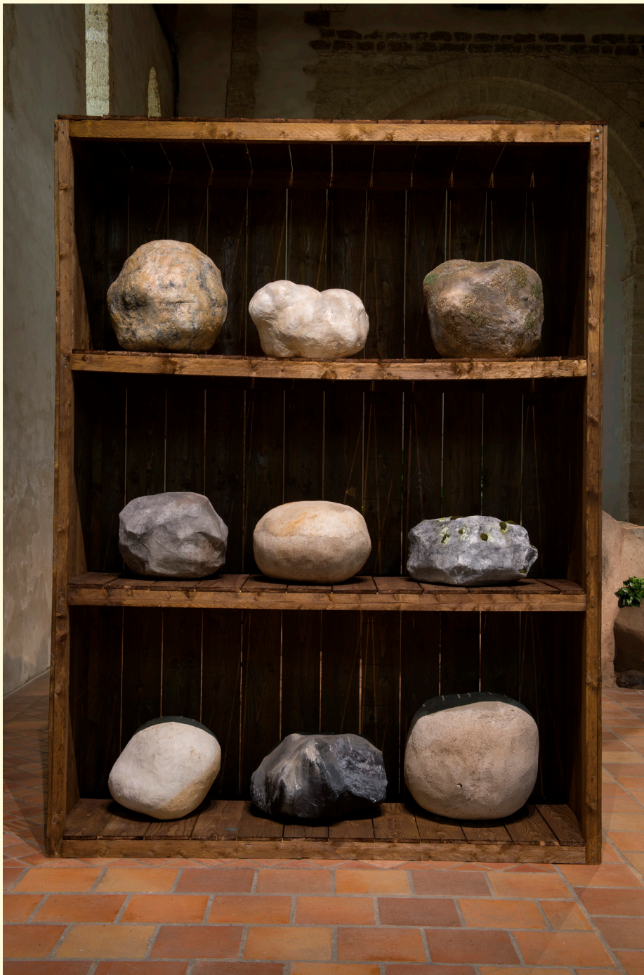
4. Collection de pierres , 2017. Pierres factices, pin et brou de noix, 320 × 240 × 80 cm. Courtesy Semiose, Paris. Photo : Marc Damage.

Laurent Le Deunff My Prehistoric Past 10.10.21 > 20.03.22