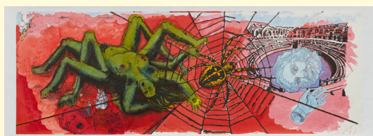
A&P Poirier, Le Purgatoire , 2020. © Anne et Patrick Poirier, collection des artistes.

-> Sur présentation d'un justificatif: moins de 18 ans, demandeurs d'emploi, bénéficiaires de minima sociaux, bénéficiaires de l'AAH, étudiants et professeurs art et architecture, journalistes, membres Icom et Icomos, personnels de la culture, personnels du Conseil régional Occitanie / Pyrénées-Méditerranée.